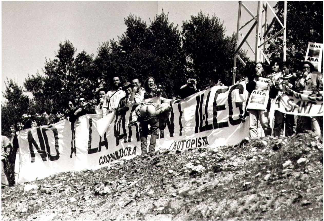
Inauguració de la variant (27/03/93)