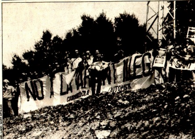
A dalt, el seguici contempla el vídeo de propaganda del MOPT a dins d'un túnel. A baix, un manifestant ensenya el cul.