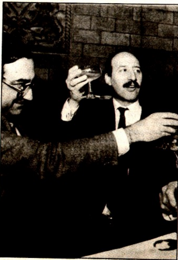
L'alcalde i el ministre, brindant per la variant.