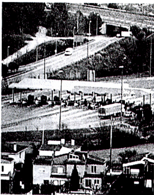
El peatge d'accés a l'autopista A-7, a l'alçada del terme municipal de Sarrià de Ter.

Aquesta mateixa setmana, la Generalitat també s'ha sumat al front comú per reclamar aquesta nova sortida.